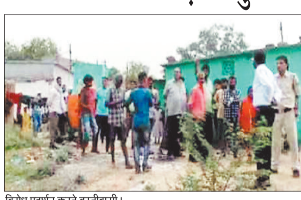
विरोध प्रदर्शन करते बस्तीवासी।

बुधवारी बाय पास में कुंआ भट्टा नामक बस्ती बसी हुई है जहां 40 परिवार निवास करते हैं। उक्त 40 परिवार की जमीन को एक निजी कंपनी अपना बता रही है और न्यायालय के आदेश पर प्रशासन और पुलिस उक्त मकानों को तोड़ने के लिए पहुंची थी जहां बस्तीवासियों के आक्रोश के सामने प्रशासन की एक न चली और प्रशासन को उल्टे पांव लौटना पड़ा। बताया जाता है कि प्रशासन दो तीन दिनों के भीतर फिर से वहां मौके पर मकानों को तोड़ने के लिए फिर से पहुंचेगी ऐसा बस्तीवासियों का कहना है।