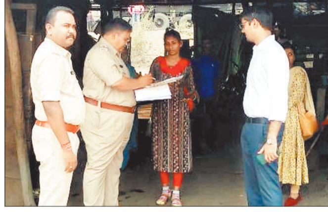
ढाबा पर कार्यवाही करती पुलिस व खाद्य विभाग की टीम।