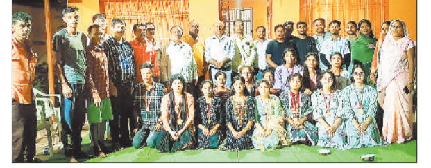
सम्मानित हुए विद्यार्थी।

अंबिकापुर-कटघोरा राष्ट्रीय राजमार्ग पर गुरुवार की सुबह एक बड़ा हादसा हो गया। इस हादसे में अंबिकापुर की ओर से आ रही डीजल से भरी टैंकर महानदी पुल से पहले ढलान पर पलट गई, जिससे सड़क किनारे लगी रेलिंग केबिन में घुस गई। वहीं टैंकर में भरा डीजल भी सड़क पर बह गया। इस हादसे में टुक चालक को चोट आई है, जिसे अस्पताल ले जाया गया है। घटना का सुखद पहलू यह रहा कि हादसे के समय आपसपास कोई अन्य वाहन नहीं गुजर रही थी अन्यथा डीजल टैंकर की चपेट में आने से बड़ी अनहनी हो सकती थी।